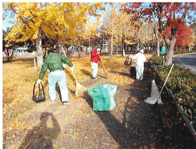
芦屋市総合公園清掃の様子

一般企業就労が難しい方、離職された方、仕事をする事で社会的自立を目指したい方へ、働く場を提供するとともに、就労的知識や能力向上のために必要な訓練を行います。