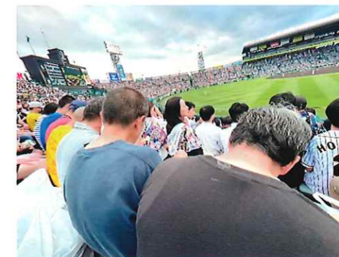
プロ野球観戦(甲子園)