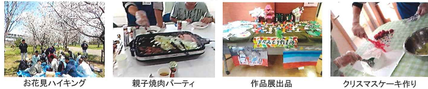
お花見ハイキング