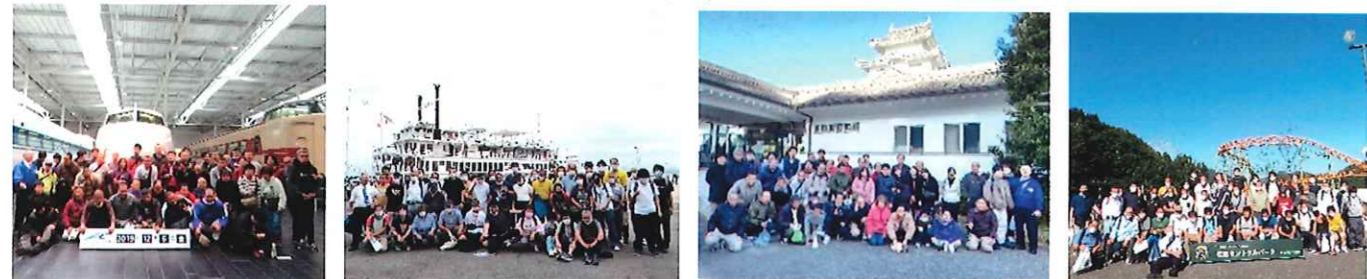
愛知県リニア・鉄道館