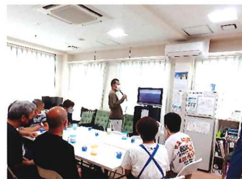
ホームレク カラオケ

カラオケ、ボーリング、買い物、外食、ナイトハイキング、プロ野球観戦、卓球、バーベキュー等