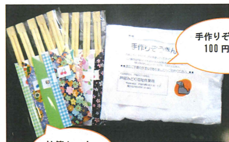
手作りぞうきん 100円