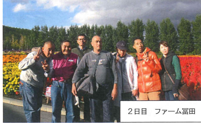
2日目 ファーム富田