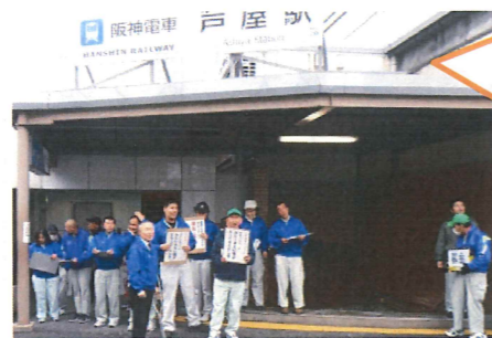
二月一七日、阪神芦屋駅前 で署名活動を行いました。 ご協力ありがとうございました。