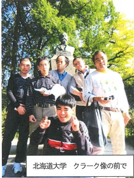
北海道大学 クラーク像の前で