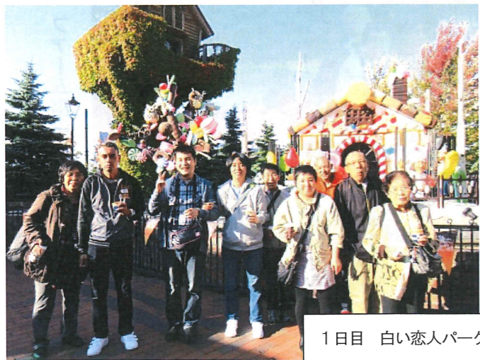
1日目 白い恋人パーク