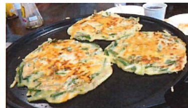
写真:クッキー、パンケーキ クリスマスケーキ、チヂミを 皆で協力し合って作りました。