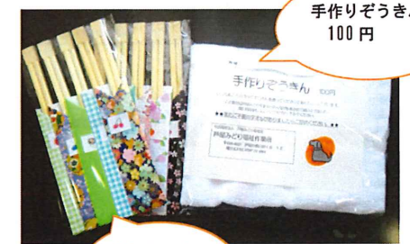
手作りぞうきん 100円