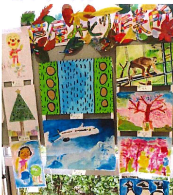
写真:芦屋市障がい児・者作品展 毎週木曜日の絵画の時間に 作った作品を出品しました。