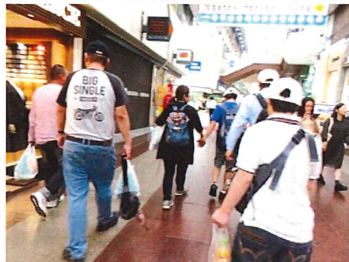
1日プログラムで 三宮へ買物です