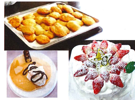
みんな大好きな調理の時間です。