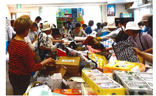
今年もやります。ぜひ遊びに来てください。